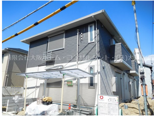
完成予想図のため、実際とは異なる場合があります。

1フロア2住戸, 24時間緊急通報システム, カードキー, セキュリティ有り, 角住戸, 振り分け, 通風良好, 陽当たり良好, 駅まで平坦, 閑静な住宅街, 防犯カメラ, メールボックス, 周辺交通量少なめ, 整備された歩道